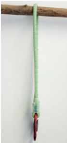
pic.1) Double strand

This anchor device can be used in double strand configuration: